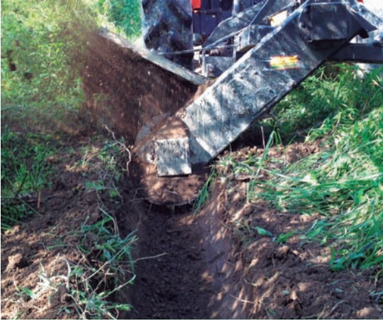
Drenajes superficiales realizados con el Ditcher.

Se requiere un tractor de 90 HP para su operación y su rendimiento es variable según el tipo de suelo; en los suelos pesados, tiene un rendimiento promedio de 600 metros lineales por hora; realizando el drenaje en surcos de por medio, el rendimiento es de aproximadamente 4.500 metros lineales. La profundidad adecuada puede ser de 30 cm, ya que facilita el drenaje superficial y no dificulta demasiado otras labores del cultivo.