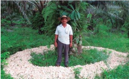
Aplicación de materia orgánica (tusas de maíz) en el plato de la palma.