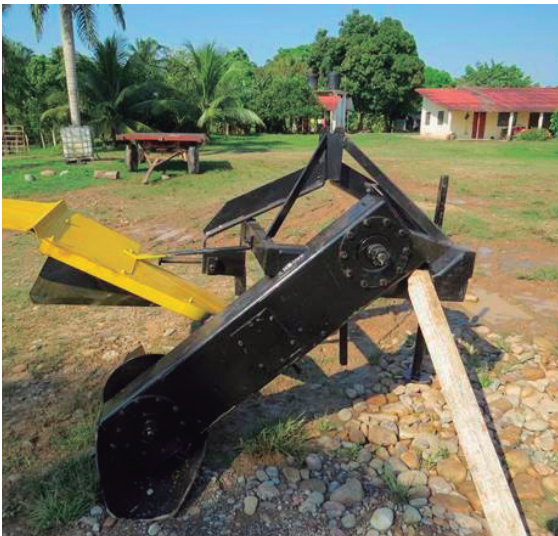
Ditcher – zanjeador mecánico.

Con respecto a encharcamientos puntuales en el lote, se deben realizar drenajes superficiales. Estos drenajes superficiales pueden ser realizados por un implemento denominado Ditcher o zanjeador mecánico, el cual realiza canales de drenaje y cuyo mecanismo de sinfín giratorio expulsa el suelo a una distancia prudente del canal, logrando canales sin bordas laterales que permiten una perfecta evacuación del agua.