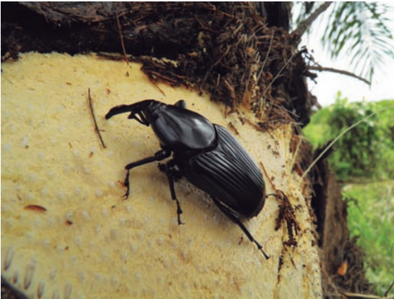
Rhynchophorus palmarum , vector del Anillo rojo.