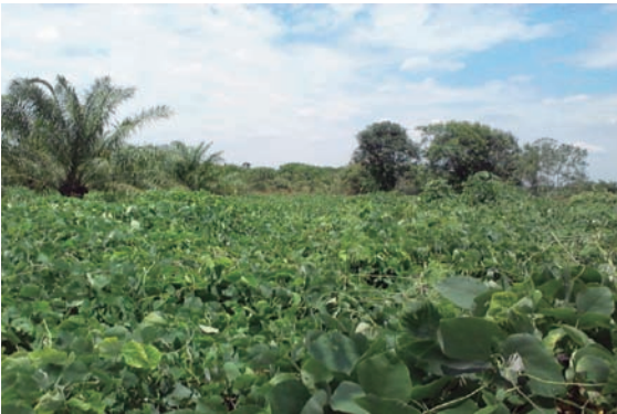
Plantación con establecimiento de coberturas.