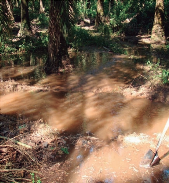
Aplicación de riego por gravedad.

El exceso de agua sobre el perfil del suelo en el cultivo genera pudrición de raíces, tener encharcamientos de agua en el lote es un factor predisponente para la presencia de enfermedades como la Pudrición del cogollo , esto debido a que su agente causal Phytophthora palmivora está en condiciones óptimas de diseminación acelerada.