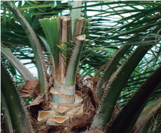
Palma en emisión sana luego de una cirugía por Pudrición del cogollo.

Las plagas y enfermedades son “incendios” en el cultivo. Hay que prevenirlos pues apagarlos, sale muy costoso.