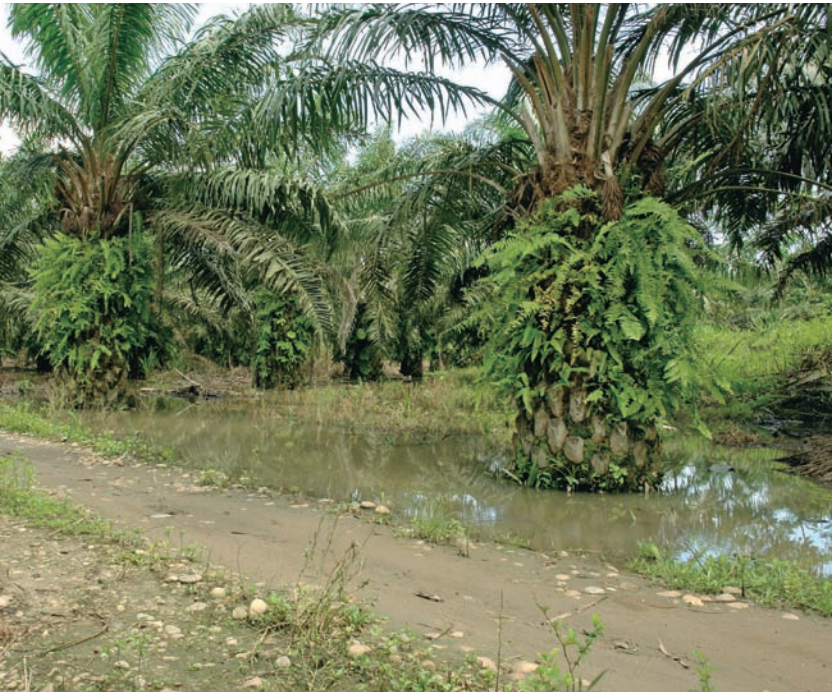
Lote sin sistema de drenaje adecuado.

Este recurso afecta las plantas de forma positiva o negativa de acuerdo con el buen o mal manejo que se le dé en las plantaciones. Por lo que se debe manejar tanto el exceso de agua, con los respectivos drenajes, como la aplicación de riego por escasez de la misma en algunas épocas del año.