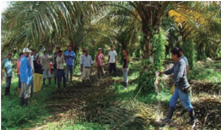
Aplicación de fertilizante sobre materia orgánica.