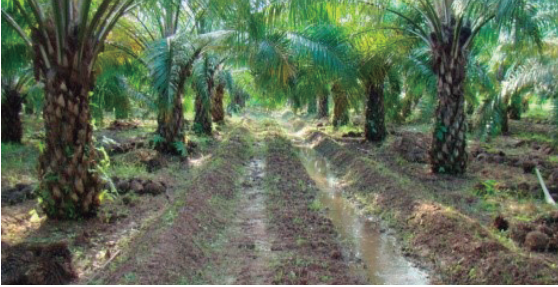
Riego por melgas en palma adulta.