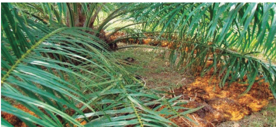
Aplicación de materia orgánica (tusa) en el plato de la palma.

Las formas de mulch más recomendadas en plantaciones de palma de aceite son las tusas de racimos, las hojas de la palma y el corte de leguminosas, aunque también puede utilizarse fibra, compost, desechos de otros cultivos como bagazos de maíz, gallinaza y estiércol.