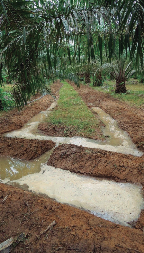
Sistema de riego por surcos anchos alternos.