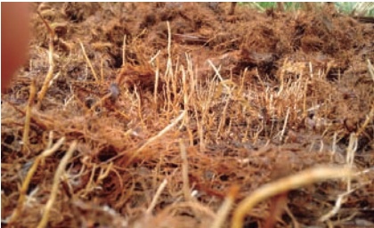
Estimulación de raíces en el plato de la palma por aplicación de materia orgánica.