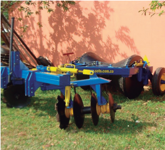
Implemento taipa.

La melga es una franja de terreno delimitada por dos bordas paralelas a través de las cuales circula agua de riego, al aplicar el agua de gasto de riego sobre la melga se produce un escurrimiento superficial y otro subterráneo denominado infiltración.