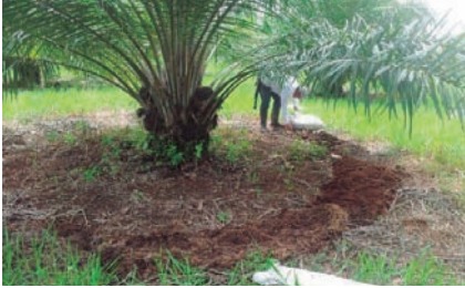
Aplicación de materia orgánica (compost) en el plato de la palma.