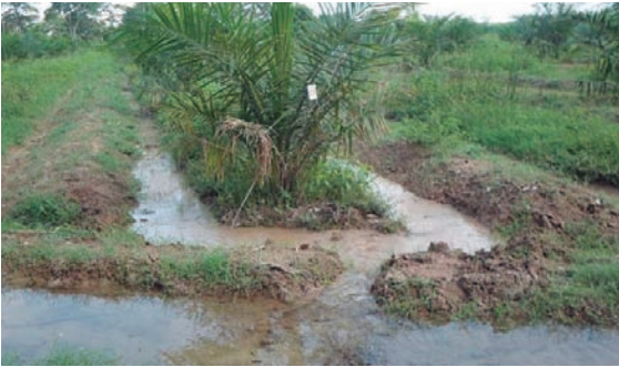
Riego por melgas en palma joven.

Los bordes se pueden construir con una taipa (equipo utilizado en arroz que se adaptó para el cultivo de la palma de aceite, para la construcción de curvas de nivel para riego), y el ancho del surco de riego varía de 1,50 a 2,50 metros, dependiendo de la velocidad de infiltración del suelo. En los suelos arenosos debe ser más angosto y en los arcillosos (poca infiltración), más ancho.