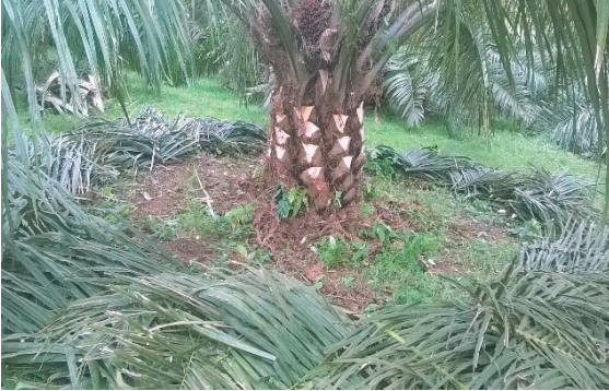
Aplicación de materia orgánica (hoja) en el plato de la palma.

La materia orgánica permite soportar hasta dos meses de déficit hídrico en algunas zonas del país donde la transpiración del cultivo no es tan alta.