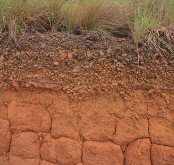
Perfil del suelo en tiempo de sequía.

Por otro lado, cuando la palma tiene déficit de agua presenta una serie de síntomas que pueden incluso causar la muerte de la misma.