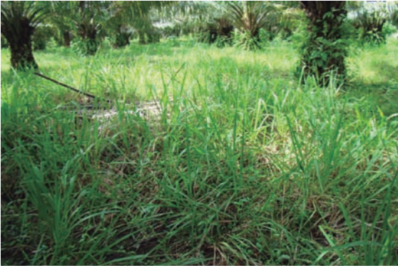
Plantación con gramíneas.