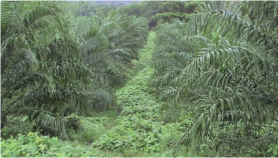
Plantación con establecimiento de coberturas.

Muchos de los lotes donde se sembró el cultivo de la palma estaban dedicados a ganadería y otros cultivos donde predominan los pastos (gramíneas). Cuando tenemos gramíneas en el cultivo se presenta una competencia directa de este tipo de malezas al momento de realizar la fertilización del cultivo, al igual que en sus macollas se reproducen insectos plagas como leucotyrius sp (defoliador de la palma), haplaxius crudus , vector de la enfermedad Marchitez letal.