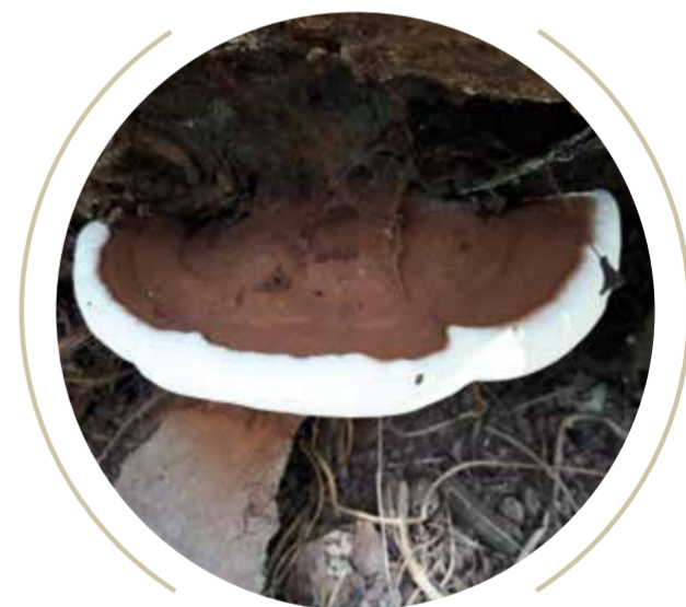
Carpóforo de Ganoderma spp. en la base del tallo