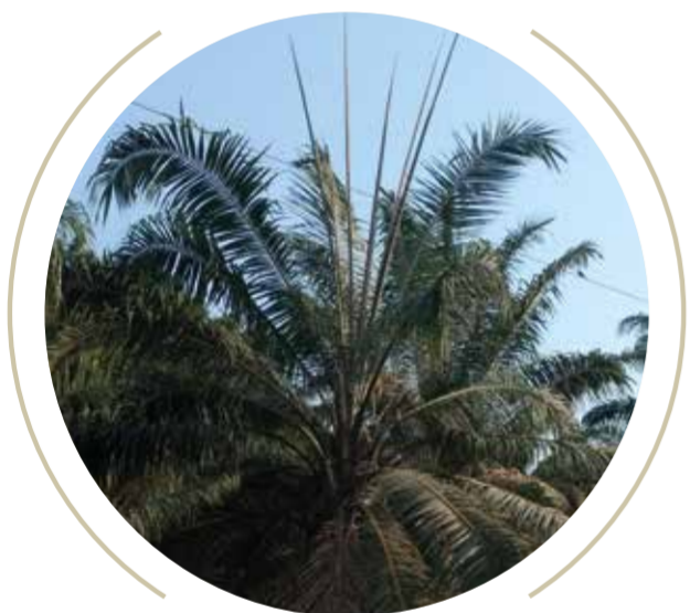
Acumulación de flechas