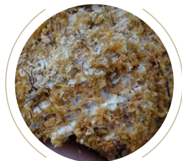
Micelio del hongo dentro del tallo