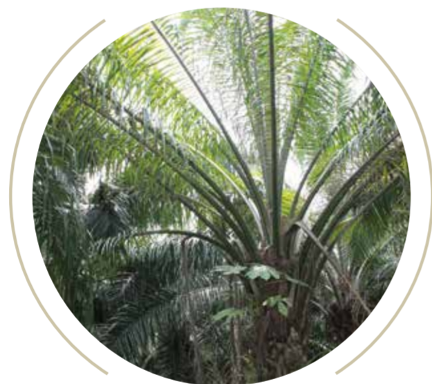
Amarillamiento de hojas jóvenes