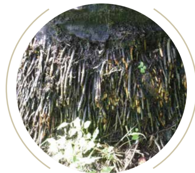
Aumento en la producción de raíces adventicias