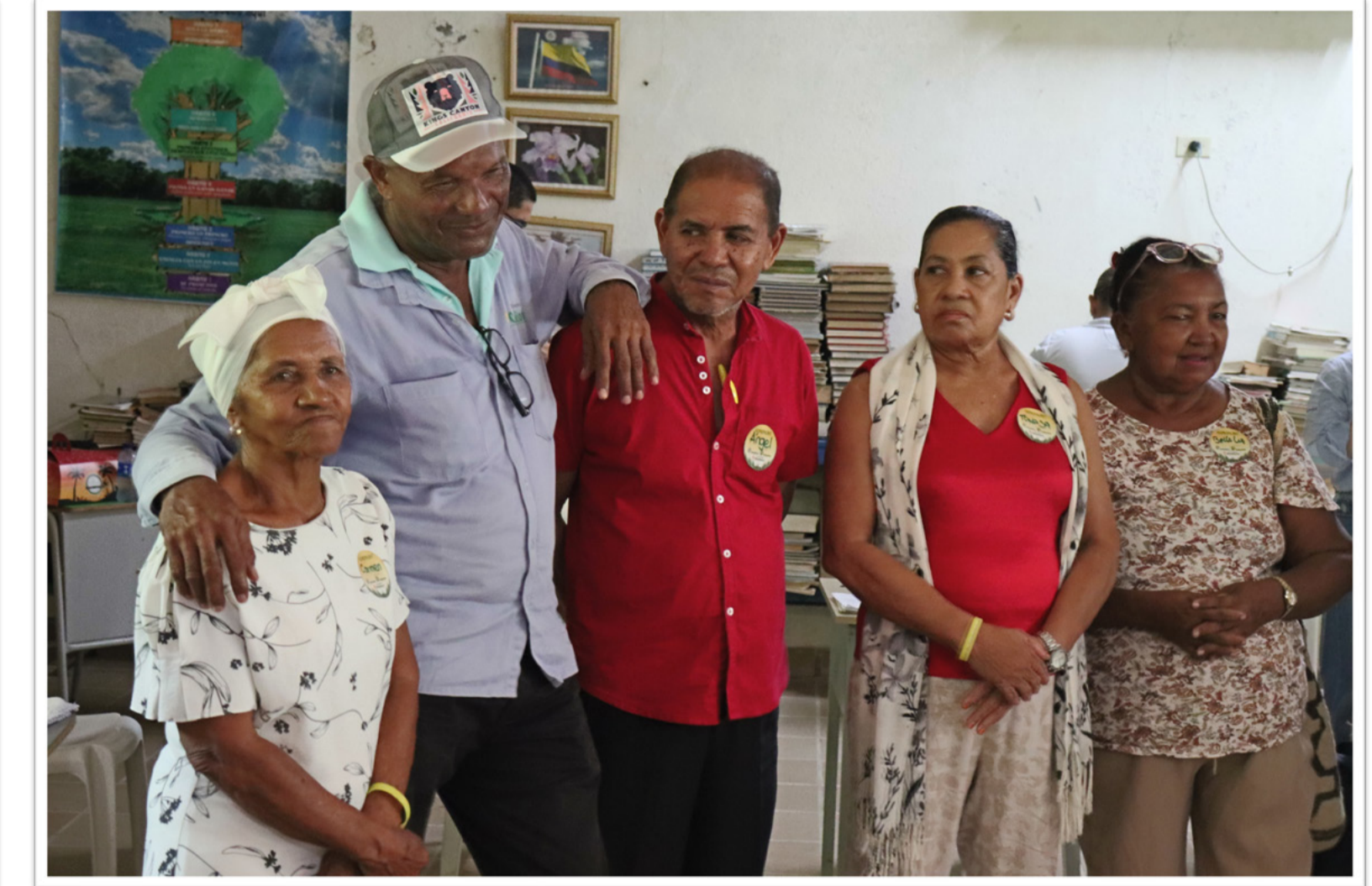
2. Estimular el posicionamiento del saber del adulto mayor en la conducción de la empresa.