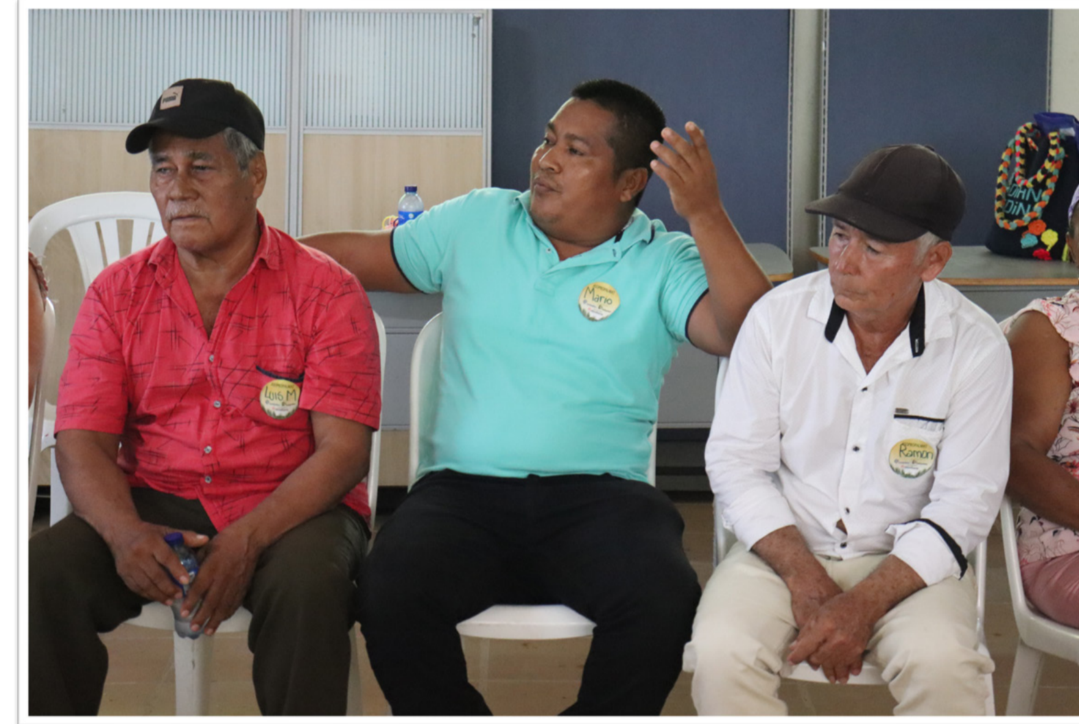
1. Orientación para ampliar la visión del negocio de la palma más allá del cultivo.