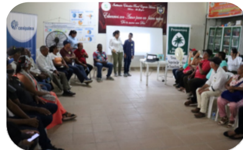
Reflexión y análisis conjunto