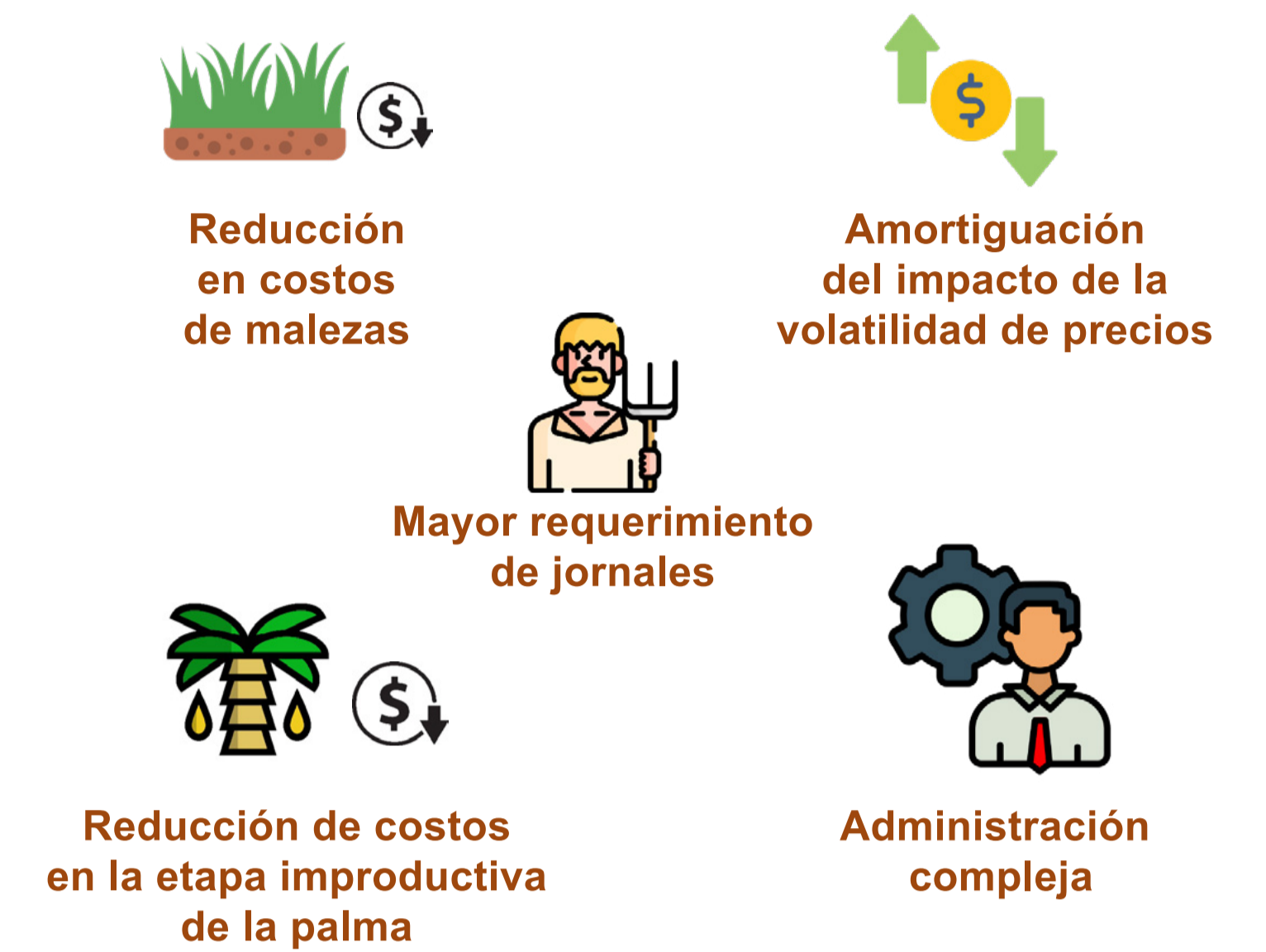
Figura 3. Algunas consideraciones económicas de los SCI.