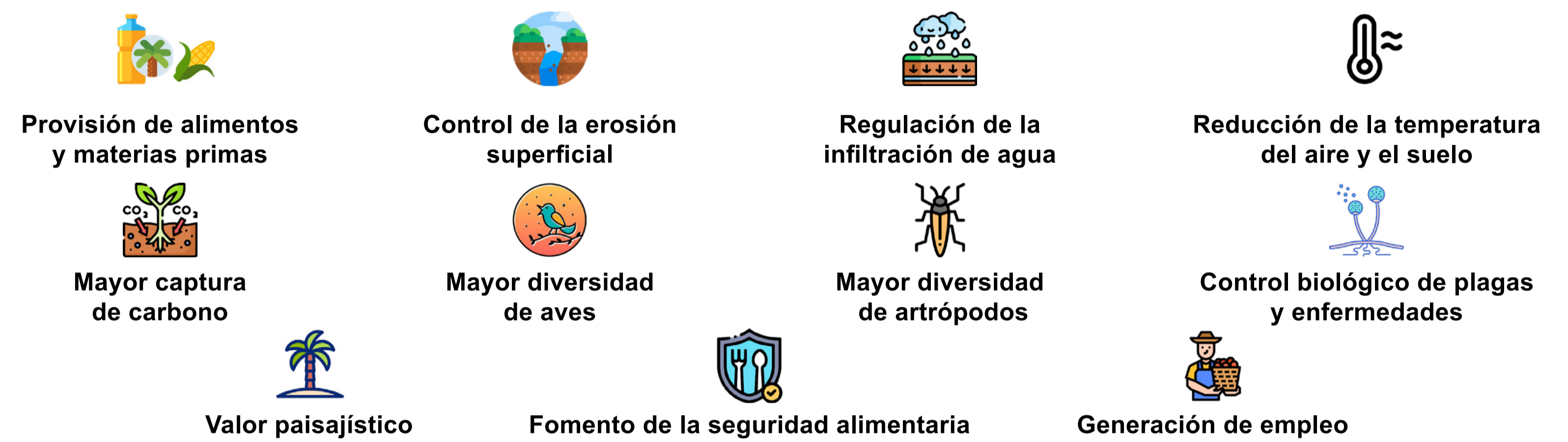
Figura 4. Algunas consideraciones ambientales de los SCI.

El cultivo intercalado con palma de aceite mejora la biodiversidad, fomenta el control natural de plagas, regula los microclimas y mejora la eficiencia del uso de la tierra, lo que lo convierte en una práctica clave para la transformación sostenible del sistema de producción (Figura 4).